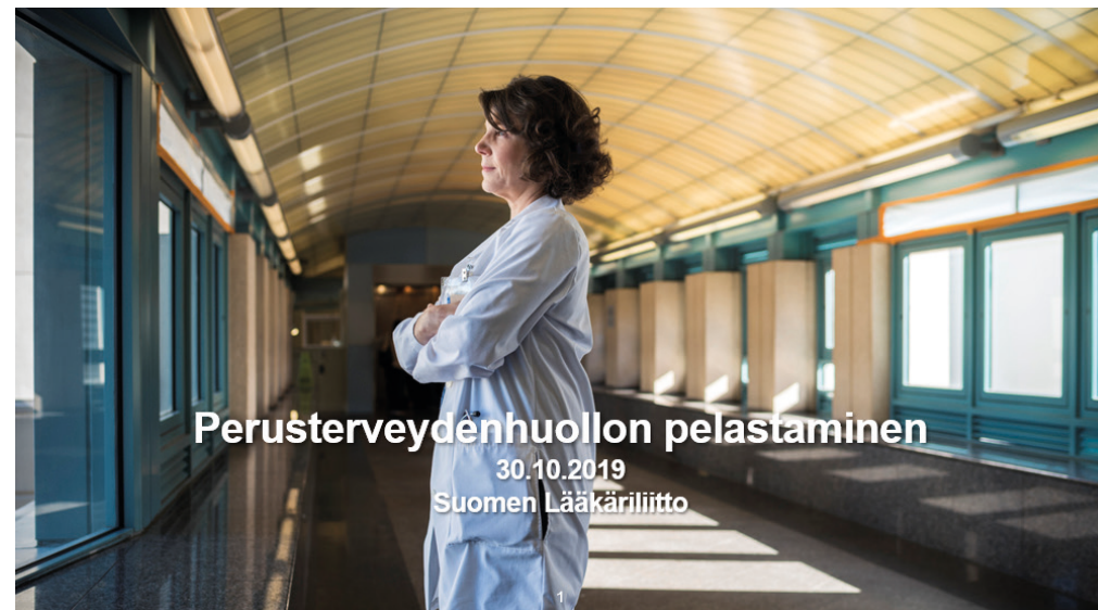
Liitto julkaisi lokakuussa 2019 kannanoton perusterveydenhuollon pelastamiseksi.

Lääkäriliitto on pitänyt aktiivisesti esillä tavoitettaan perusterveydenhuollon hoitotakuun kiristämisestä. Tämä oli liiton keskeisiä tavoitteita myös eduskuntavaaleissa. Perusterveydenhuollon lääkärin vastaanotolle tulisi päästä viimeistään viidentenä arkipäivänä hoidontarpeen arvioimisesta, mikäli arvioissa on todettu lääkärin tutkimusten tai hoidon tarve. Eduskuntavaalien jälkeen aloittanut hallitus ottikin asian hallitusohjelmaan. Lakimuutoksen valmistelua on aktiivisesti seurattu.