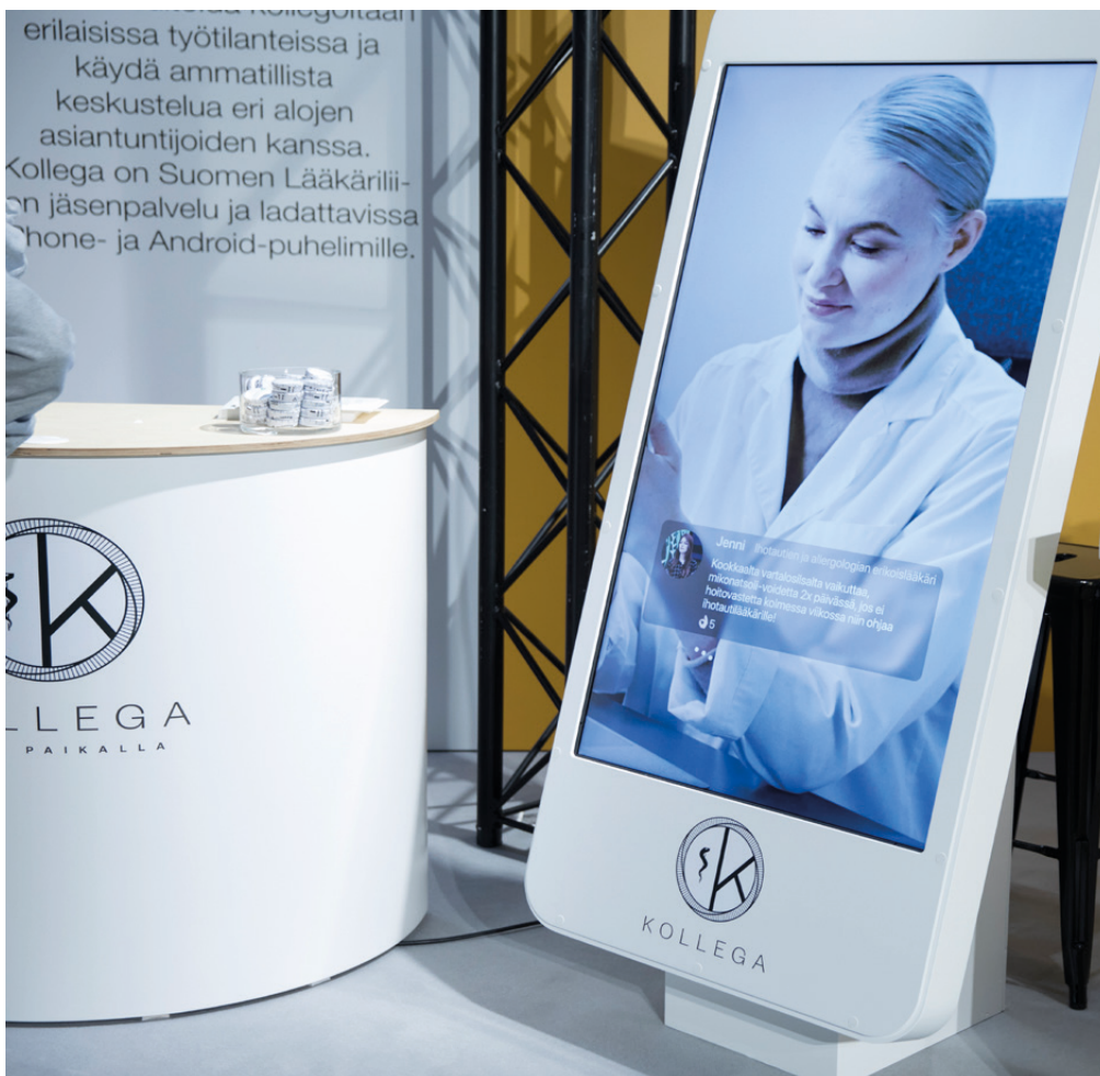
Konsultoi kollegaa -sovellus otettiin käyttöön tammikuussa 2019.