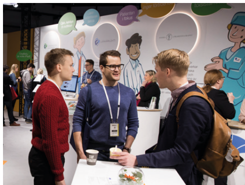
Lääkäri 2019 -tapahtuma järjestettiin 9.–11.1.2019 Messukeskuksessa. Päivien teemana oli luottamus.